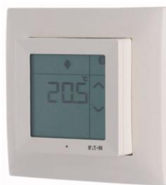
Termostat (Art.nr 187712)