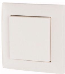
Trykknapp (art.nr 173411)